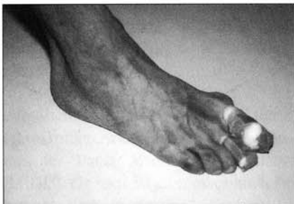
Abbildung 5: Abpolstern der Zehen mit Watte und Pflaster

Zahlreiche Funktionskriterien unterscheiden den Spitzenschuh vom sportlichen Laufschuh. Beim Spitzentanz ist die Stabilität in der geforderten vertikalen Bewegungsachse gewährleistet, während dies beim Laufschuh in der dorsoventra-