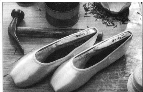
Abbildung 4: Der fertige Schuh über dem Leisten

Leider ist die vorgestellte Ballettschuhmacherei eine Rarität. In der Realität des Tänz-