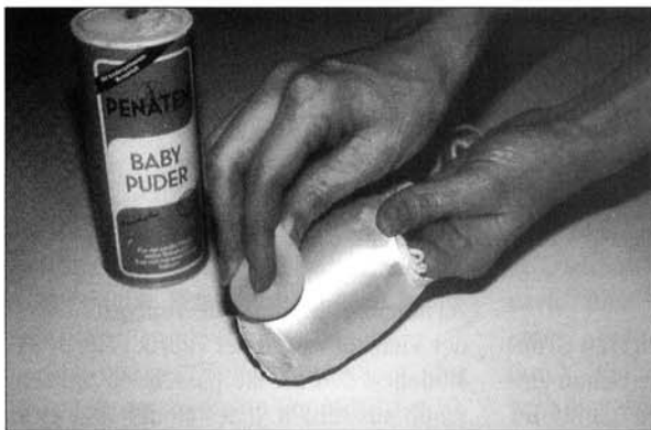
Abbildung 7: Abdecken der glänzenden Seide mit Puder

häufig der Stoff auf der gesamten Standfläche entfernt. So bleibt das im Tanz häufig verwendete Collophonium - das zur Verbesserung der Haftfähigkeit auf dem Boden dient - leichter am Schuh kleben. Die glänzende Atlasseide wird mit Schminke und Puder abgedeckt, um eine möglicherweise störende Reflexion durch die Scheinwerfer auf der Bühne zu verhin-