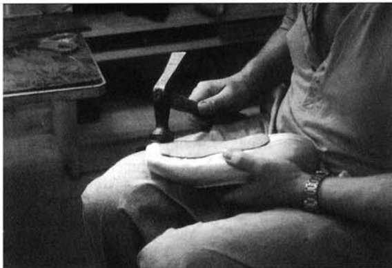
Abbildung 3: Glätten von Unebenheiten mit dem Hammer

schmeidigen Übergang vom Metatarsalköpfchenstand (demi point) in die En point-Stellung der Tänzerin zu gewährlei-