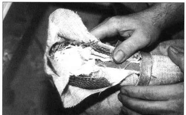
Abbildung 2: übereinandergelimeite Rupfenschichten

Der Spitzenschuh wird überwiegend aus natürlichen Materialien hergestellt, d.h. aus Seide, Leinen, Pappmaché-Ledergemisch und Kartoffeldextrin. So wird der